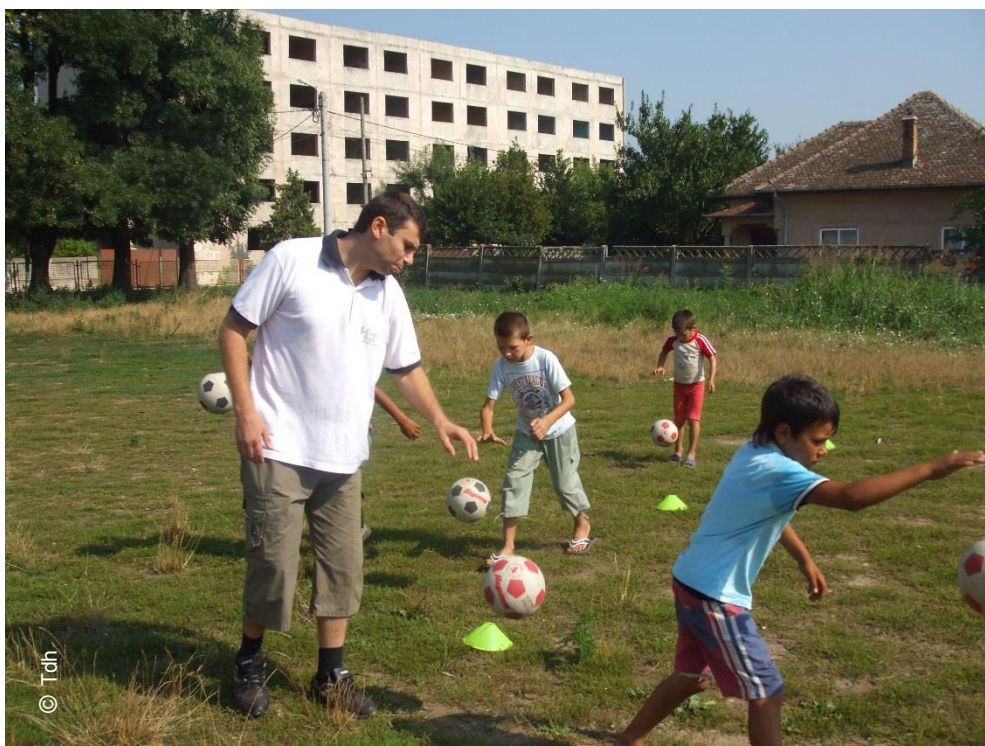
Foto: Elevi ai școlii gimnaziale "Amza Pelea" din Băilești, județul Dolj. Activități de vară, august 2010